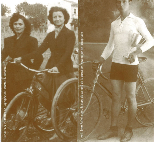
circa 1945. Memòries de l'Agrupación Ciclista Coliblanch.