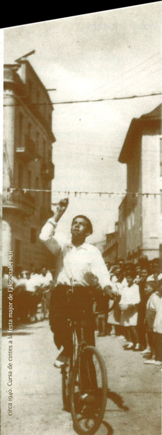
circa 1940. Cursa de crítics a la festa major de l'Hospitalet del 1941

I a tots/tes els altres col·laboradors/res